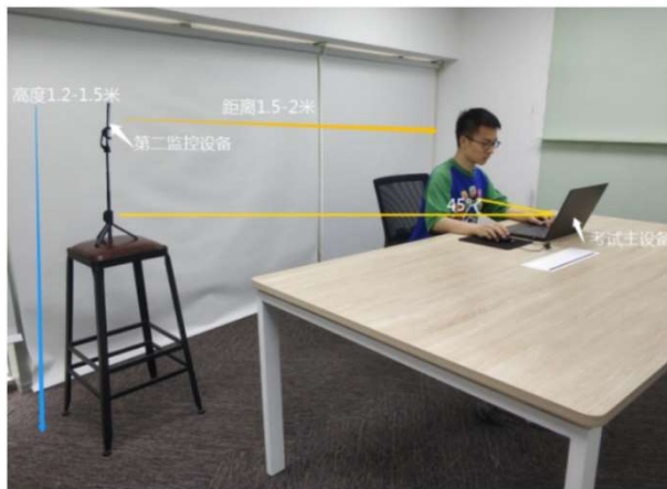
图：第二机位监控设备摄像头须架设在考试设备的侧后方